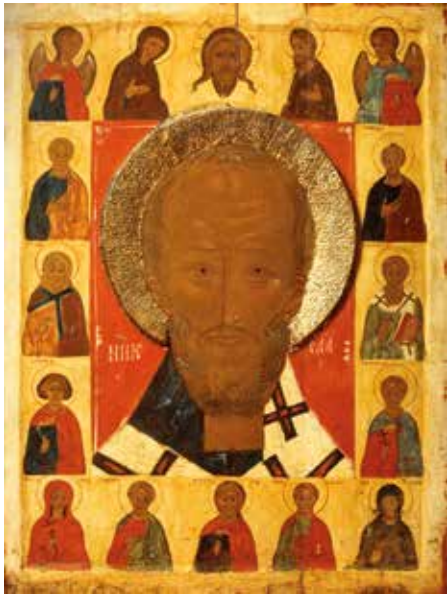
Икона. Святой Николай Чудотворец с деисусом и избранными святыми Первая половина XVI века