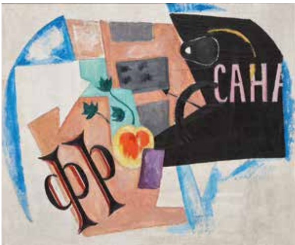
Ольга Розанова Кубистическая композиция с фруктом 1914-1915

Нынешний показ отражает основные пути развития русского искусства, которое, как и вся культура этой страны, проходило этапы близости к европейским моделям, сменявшиеся увлечением национальными традициями.