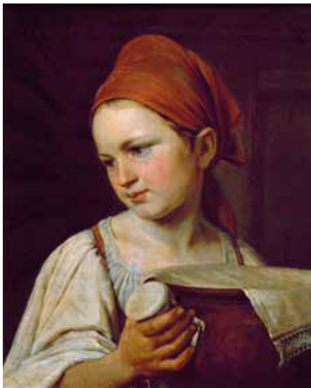
Алексей Венецианов Молочница (Крестьянка с подойником) Не позднее 1826

Русский музей из Санкт-Петербурга начинает показ своей коллекции в Малаге с представления ста произведений, отражающих эволюцию русской живописи от иконописи до середины XX столетия. Такой обобщающий характер экспозиции останется неизменным на весь период сотрудничества с «Табакалера». Ежегодно будут меняться тематическая основа экспозиции и состав произведений.