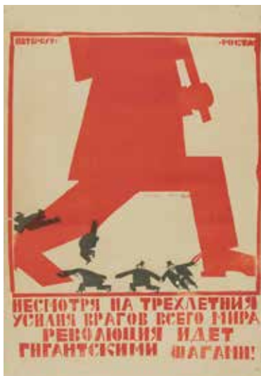
Vladimir Kozlinski A pesar de los esfuerzos durante estos tres años de nuestros enemigos de todo el mundo, la revolución avanza a pasos agigantados Petersburgo-ROSTA. 1920 Linograbado pintado. 70,3 x 50,2 cm