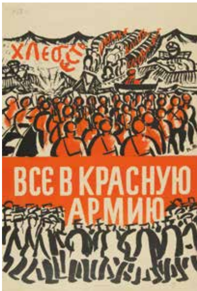
Piotr Miturich Untos al Ejército Rojo. 1918 Cromolitografía. 82 x 51,5 cm