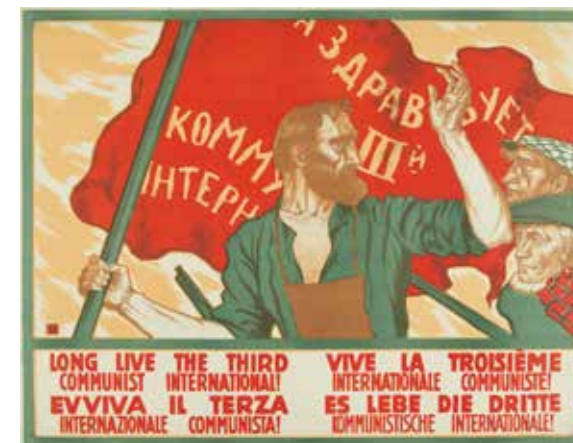
Serguéi Ivanov ¡Viva la Tercera Internacional Comunista!. 1920 Cromolitografía. 66,5x87,5 cm