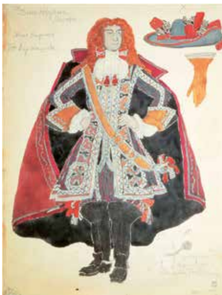
Александр Головин Дон Кихотос. Эскиз костюма а к комедии Мольера «Дон Жуан» 1910

Эпоха Дягилева» – первая выставка, открытая в Малаге на основе коллекции Русского музея из Санкт-Петербурга. Она знакомит зрителей с произведениями художников, работавших с Сергеем Дягилевым в то время, когда он вместе с единомышленниками создал журнал «Мир искусства» и одноименное творческое объединение, а также организовал целый ряд выставок с тем же названием.