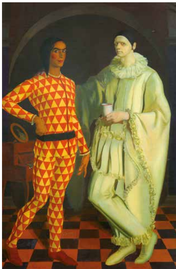
Василий Шухаев и Александр Яковлев Автопортреты (Арлекин и Пьеро) 1914

КОЛЛЕКЦИЯ РУССКОГО МУЗЕЯ Avenida Sor Teresa Prat, 15. 29003 Малага (Испания) www.coleccionmuseoruso.es Телефон: (+34) 951 926 150 info.coleccionmuseoruso@malaga.eu educacion.coleccionmuseoruso@malaga.eu