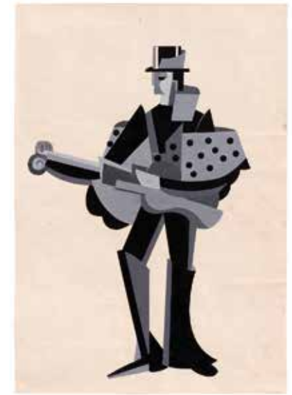
ALEXANDRA EXTER Diseño para una marioneta . 1926 Gouache sobre papel 50,5 x 35,5 cm Sello de propiedad en el reverso: "Gouache Alexandra Exter" Colección Krystyna Gmurzynska

Rojo de Leningrado (1931-1932). El concepto de Malévich consistía en un enfoque no objetual completamente nuevo en cuanto a la decoración de espacios públicos. En una carta de Malévich a Lepórskaia se indican con toda claridad consideraciones específicas en cuanto al tratamiento del color. En esa misma carta se aprecian las inflexibles exigencias del artista: en el caso de que su idea se alterase de algún modo, renunciaría al proyecto. Los bocetos del decorado del Teatro Rojo, propiedad de la colección Gmurzynska, ilustran de manera relevante cuál habría sido el aspecto de los interiores si el teatro no hubiera ardió en 1932.