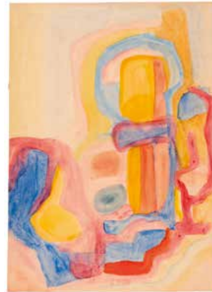
MARIA ENDER Composición . 1920 Acuarela sobre papel. 40,8 x 30 cm Inscrito en el reverso: "vh 4254" Colección Krystyna Gmurzynska