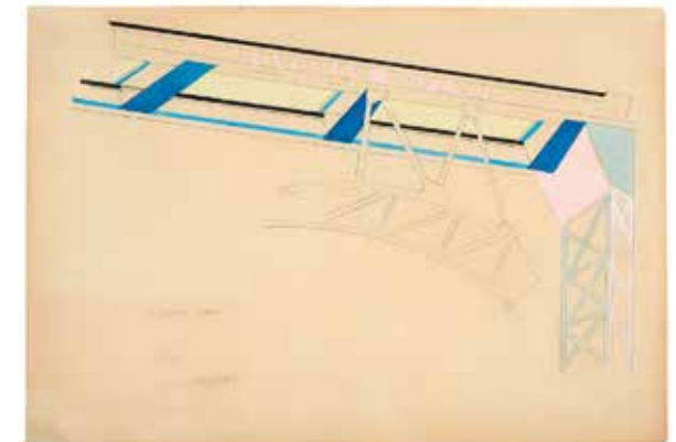
ANNA LEPÓRSKAIA KAZIMIR MALÉVICH Techo de un arco en la sala de hierro de la Casa Estatal del Pueblo (Gosnardom) . 1931 Lápiz y gouache sobre papel. 44 x 63,5 cm Inscripción, firma y fecha abajo a la izquierda: "techo colgante, arco, año 31, Lepórskaia". Firma, título y fecha en el reverso "Lepórskaia, techo de un arco en la sala de hierro de la Casa Popular del Estado, gouache sobre papel, 44 x 63,5, año 1931" (en ruso). Colección Krystyna Gmurzynska