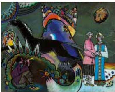
Vassily Kandinsky. La nube de oro . 1918 Óleo sobre cristal, 24 × 31 cm

impresiones, de la experiencia acumulada y de reflexiones. Poseedor, como muchos otros artistas, del don del presentimiento, Kandinsky expresaba en sus lienzos no sólo sus ideas y emociones, sino también el estado de la época en que le tocó vivir. El universo plástico y colorista de los lienzos de Kandinsky, en los que ahora prevalece el alegre color rojo, ahora domina un gris azulino, más tranquilo, ahora reina el rosa, que expresan los sentimientos y el estado anímico del propio artista, se presta a ser descifrado por los espectadores para quienes los creaba.