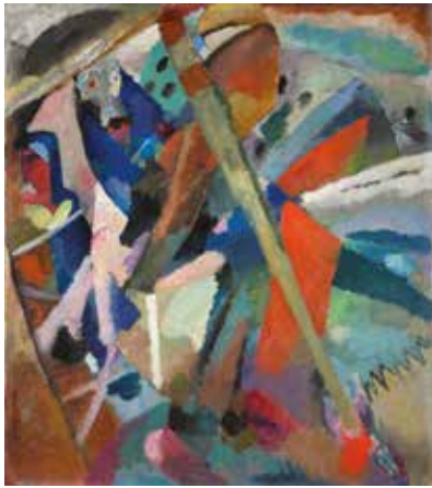
Vassily Kandinsky. San Jorge (I) . 1911 Óleo sobre lienzo, 107 × 95,2 cm © VASSILY KANDINSKY, VEGAP, MÁLAGA, 2017