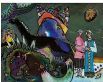
Василий Кандинский. Золотое облако . 1918 Стекло, масло. 24 x 31 © ВАСИЛИЙ КАНДИНСКИЙ, VEGAR, МАЛАГА, 2017

Произведения Кандинского 1910–1920-х годов — итог многолетних впечатлений, накопленного опыта, размышлений. Обладая, как и многие художники, даром предчувствия, Кандинский выразил в своих полотнах не только свои мысли и эмоции, но и состояние эпохи, в которой он жил. Красочная и пластическая феерия полотен Кандинского, в которых то превалирует радостный красный цвет, то господствует серо-голубой, более спокойный, то торжествует розовый, выражая чувства и настроения самого художника, «прочитываются» зрителями, для которых они создавались.