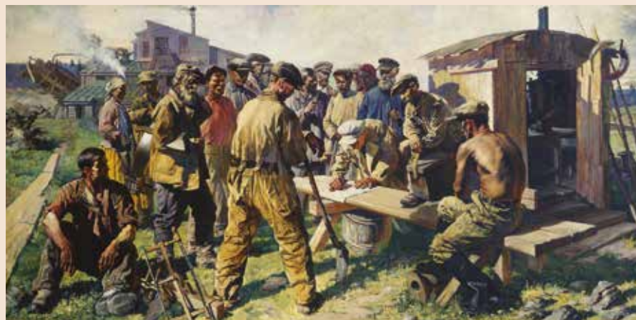
В.Н. ЯКОВЛЕВ, Старатели пишут письмо творцу Великой Конституции 1937 Холст, масло. 249 x 500 см. (В раме). Русский музей

Важное место в тематическом комплексе социалистического реализма играли произведения, посвященные труду. Художники воспевали успехи индустриализации, строительства, сельского хозяйства, вставшего на путь коллективизации, прославляли передовых рабочих