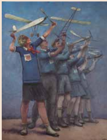
С.Я. АДЛИВАНКИН, Состязание юных моделистов. 1931 Холст, масло. 121 x 95 см (В раме) Русский музей

ществлении коммунистической утопии. Подобно мифам древности, он вплетался в ткань жизни и формировал своего рода фильтр, сквозь который советский человек должен был воспринимать реальность. Над созданием этого мифа трудилась целая армия мастеров, многим из которых удалось создать весьма талантливые и впечатляющие произведения. В них находят свое отражения не только идеологические требования и нормативы, но также коллективные желания людей, их вековые мечты о справедливости, изобилии, красоте, которые не смогли осуществиться в жизни.