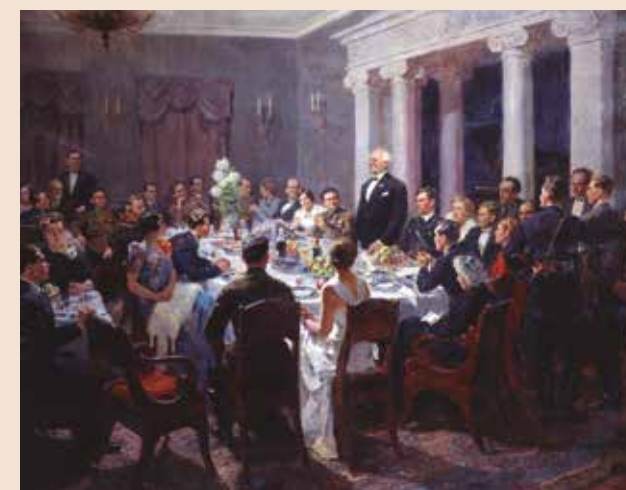
В. П. ЕФАНОВ, Встреча артистов театра имени К.С.Станиславского со слушателями Военно-воздушной академии имени Н.Е.Жуковского. 1938 Холст, масло. 297,5 x 375,5 см. (В раме). Русский музей

В общем контексте социалистического реализма самые разные жанры, темы и сюжеты могли принимать идеологическое звучание. Сложившийся канон соцреалистического произведения, помимо идеологической выверенности предполагал зрелищность, повествовательность, дидактизм. Он был адресован самым широким слоям населения и формировал оптимистический миф об осу-