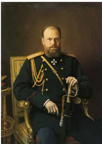
Iván Kramskói Retrato de Alejandro III . 1886 Óleo sobre lienzo. 129 × 91,5 cm