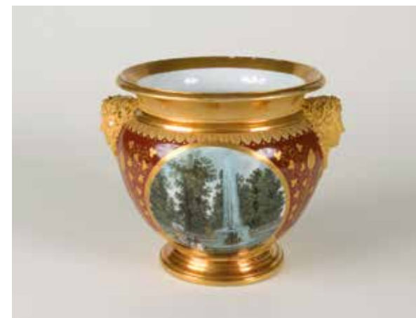
Pieza del Servicio de mesa Guriev . 1809-1816. Fábrica Imperial de Porcelanas Porcelana, modelado, pintura vidriada, dorado

Entre las obras más interesantes de esta exposición figuran las escenas pintadas por los famosos pintores Iliá Repin, Nikolái Gue, Aleksandr Litóvchenko, Vasili Schwartz, Andréi Riábushkin, Vasili Perov, así como de otros artistas cuyas obras forman parte de la exposición permanente del Museo Ruso. Su fuerza imaginativa sumergirá en un pasado lejano al espectador, que se convertirá en testigo de hechos históricos, captados en todo su dramatismo.