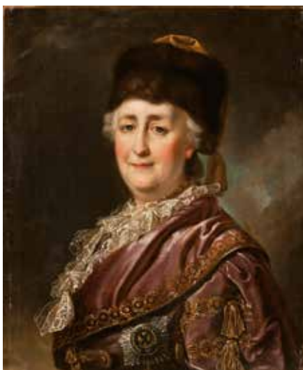
Artista desconocido Retrato de Catalina II en traje de viaje . Década de los 1780 Óleo sobre lienzo. 63 × 52 cm

La dinastía Románov (1613-1917), que gobernó Rusia durante más de tres siglos, constituyó una de las casas reales más deslumbrantes de Europa. La principal misión histórica de los Románov fue modernizar el Zarato Ruso, anclado en el medievalismo, y transformarlo en el vasto Imperio Ruso, que sería uno de los principales actores en la arena política europea e internacional. Durante este periodo, se sucedieron en el trono ruso dieciocho zares, emperadores y emperatrices. No todos estuvieron igual de capacitados para dirigir el Estado ni a todos les acompañó la buena suerte. En la vida de la Corte imperial rusa, digna de una trama shakesperiana, los triunfos y los éxitos se entremezclaban con las conspiraciones y los asesinatos de sesgo político. Esta abundancia de capítulos dramáticos, por otra parte, ha sido una constante de la historia tanto rusa como europea.