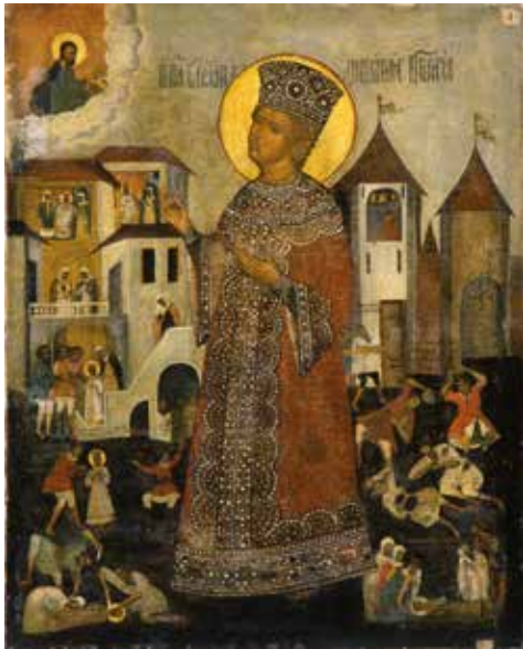
Artista desconocido El zarévich Dimitri . Primera mitad del siglo XVIII Óleo sobre lienzo. 107 × 86 cm

Destaca la extensa y significativa galería de retratos de zares, emperadores y emperatrices rusos, así como de otros miembros de la dinastía Románov. Los rostros de quienes gobernaron Rusia durante varios siglos «cobran vida» en esos retratos. Un gran número de estas obras son de reconocidos artistas de Europa Occidental que trabajaron en Rusia, lo que atestigua el ambiente artístico internacional que predominaba en la Corte imperial.