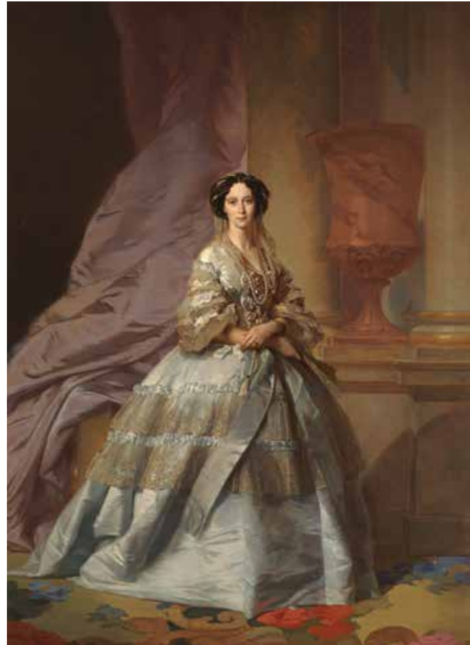
IVÁN MAKÁROV Retrato de la emperatriz María Aleksándrovna 1866. Estilo Winterhalter. Óleo sobre lienzo. 267 x 204 cm Museo Estatal Ruso, San Petersburgo