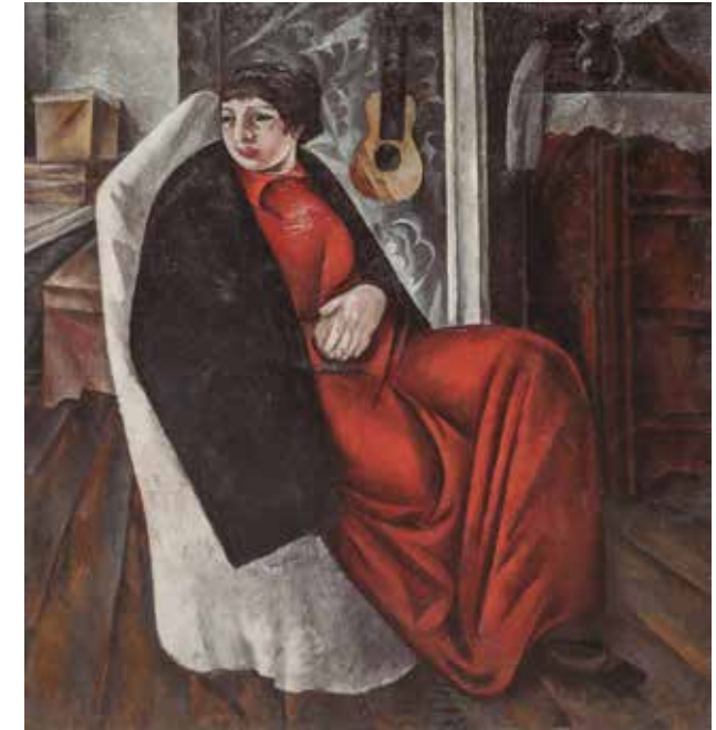
ALEKSANDR SHEVCHENKO Retrato de mujer con vestido rojo 1913. Óleo sobre lienzo. 100 x 106 cm Museo Estatal Ruso, San Petersburgo

En la Rusia prerrevolucionaria, 310 damas (grandes duquesas, representantes de los círculos más elevados) fueron condecoradas con la Orden de Santa Catalina.