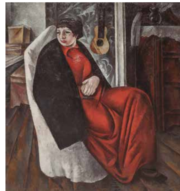
АЛЕКСАНДР ШЕВЧЕНКО Портрет женщины в красном платье 1913. Холст, масло. 100 x 106 см Государственный Русский Музей, Санкт-Петербург

В дореволюционной России 310 дам (великих княгинь, представительниц высших кругов) были награждены орденом Святой Екатерины.