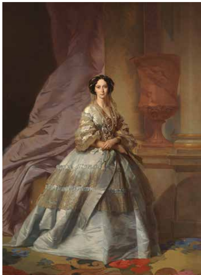
ИВАН МАКАРОВ, Портрет императрицы Марии Александровны 1866. Тип Винтергальтера. Холст, масло. 267 x 204 см Государственный Русский Музей, Санкт-Петербург