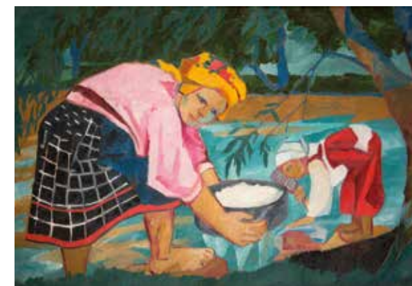
Наталья Гончарова Бабы. 1910 Холст, масло. 73 x 103