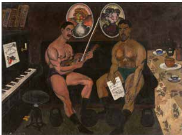
Илья Машков Автопортрет и портрет П. П. Кончаловского. 1910 Холст, масло. 208 x 270