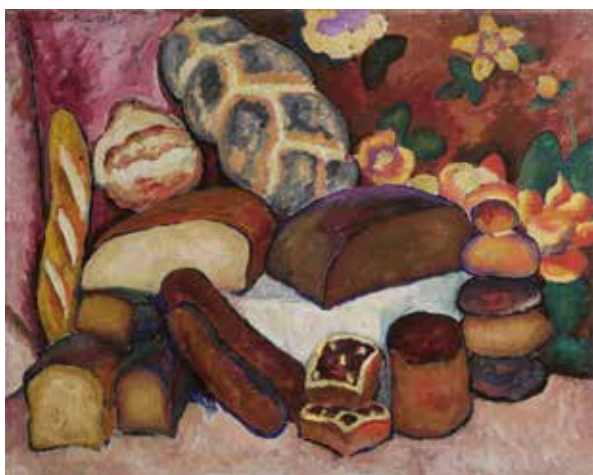
Илья Машков Хлебы. Натюрморт. 1913 Холст, масло. 105 x 133

КОЛЛЕКЦИЯ РУССКОГО МУЗЕЯ Avenida Sor Teresa Prat, 15. 29003 Малага (Испания) www.coleccionmuseoruso.es Телефон: (+34) 951 926 150 info.coleccionmuseoruso@malaga.eu educacion.coleccionmuseoruso@malaga.eu